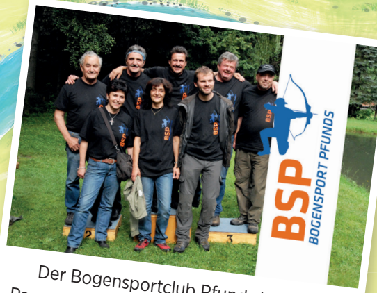
Der Bogensportclub Pfunds hält den Parcours in stand und sorgt immer für neue Highlights im Parcours.