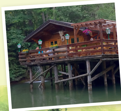
Die bekannte Pfundscher Fischeralm liegt am Eingang zum Bogenparcours - ein tolles Erlebnis für Groß und Klein! Möglichkeit zur Einkehr und zum Fischen, auf Wunsch wird der selbst geangelte Fisch sofort zubereitet. Aktuelle Öffnungszeiten finden Sie unter www.tiroler-oberland.com .