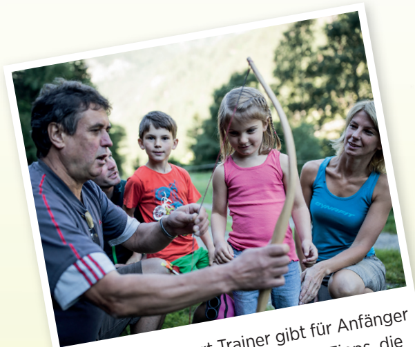
Unser Bogensport-Trainer gibt für Anfänger und Fortgeschrittene hilfreiche Tipps, die das Bogenschießen erleichtern.

Ein echtes Outdoor-Abenteuer inmitten der wild-typischen Natur des Tiroler Oberlandes. Zwischen Felsstürzen und dem Oberen Inn verschmilzt die 5 Hektar umfassende Bogensportanlage nahezu nahtlos mit dem bewaldeten Gelände der Region. An 28 Stationen mit Tierattrappen fordern Anfänger und Profis gleichermaßen ihr Abschussglück heraus.